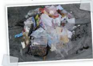
La part d'ordures ménagères « incompressible ».

Dans ce sac : 1/3 d'ordures ménagères (in-triables, in-compostables), mais surtout 2/3 de déchets qui auraient pu prendre une autre direction : Direction le compost pour le terreau, les restes de repas, le pain, le chocolat et les essuie-tout Direction le parc à container pour les canettes, pots en verre, beringots, sandales, papier carton, bâche... Bien trier et composter aurait pu faire diminuer de 2/3 le volume du sac de ce ménage.