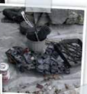
Les « posées de tri », pesant à eux seuls plus de 13 kg.

Aujourd'hui, un habitant de la commune de Baelen produit en moyenne 123 kg de déchets par an. Nous venons de faire la dé-