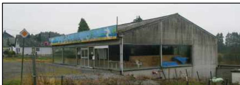
Locaux du club de pétanque et de l'harmonie Saint-Aubin à Gouvy