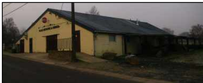
Salle l'Echo de la Ronce à Langlire