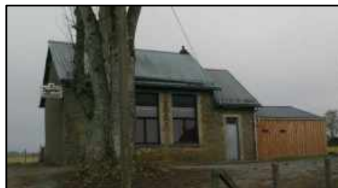
Salle de la Jeunesse de Rogery